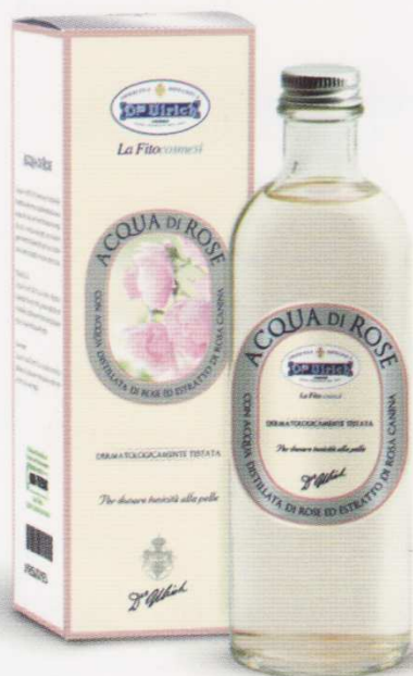
ACQUA DI ROSE 200 ml TONIFICANTE E RINFRESCANTE