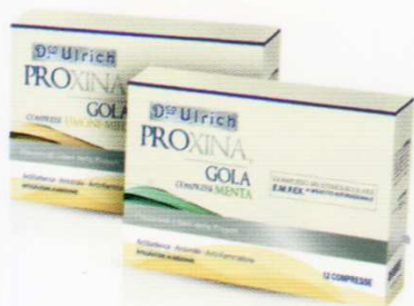
GOLA COMPRESSE 12 cpr MENTA E LIMONE-MIELE