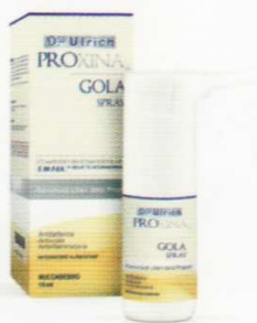
GOLA SPRAY 15 ml AZIONE ANTIBATTERICA