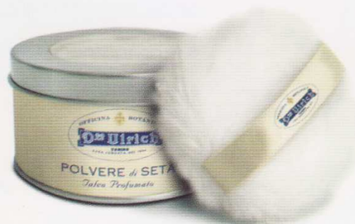
TALCO 100 g DELICATAMENTE PROFUMATO