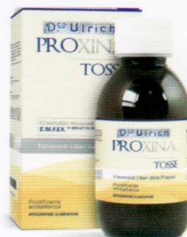
SCIROPPO TOSSE 150 ml AZIONE FLUIDIFICANTE