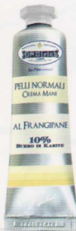
PELLI NORMALI 30 ml AL FRANGIPANE