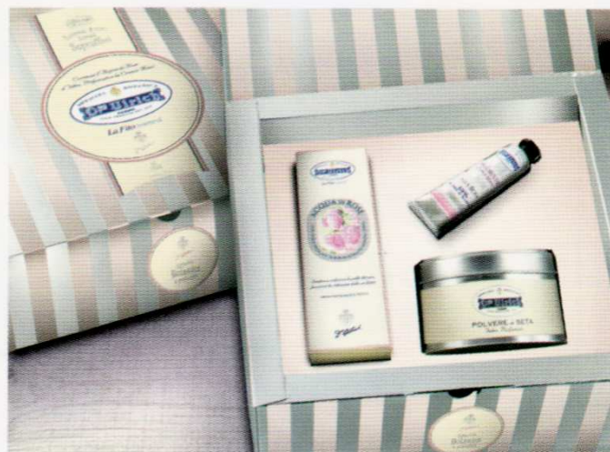
BALSAMO LABBRA. CREME MANI ALLA ROSA E AL FRANGIPANE