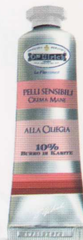
PELLI SENSIBILI 30 ml ALLA CILIEGIA