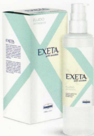
FLUIDO 250 ml AZIONE PURIFICANTE