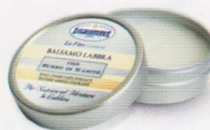
BALSAMO LABBRA 10 ml CON BURRO DI KARITE'