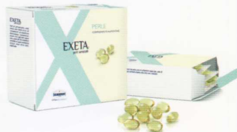
PERLE 60 cps AZIONE ANTINFIAMMATORIA