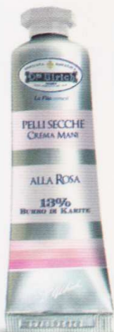
PELLI SECCHHE 30 ml ALLA ROSA