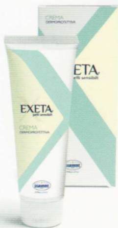
CREMA 150 ml AZIONE PROTETTIVA